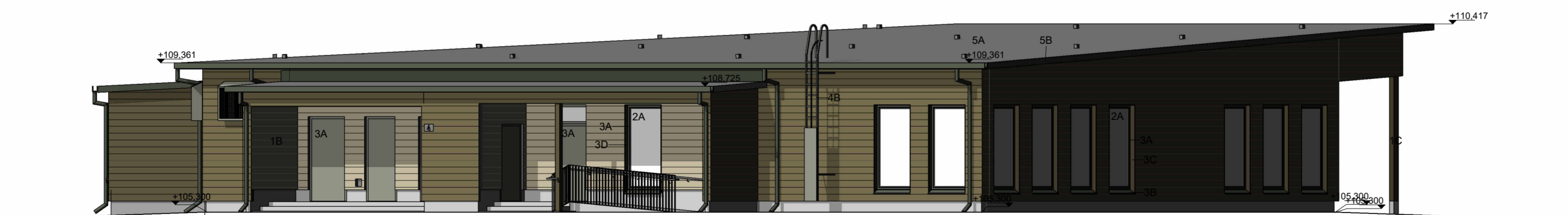
Julkisivu länteen 1 : 100