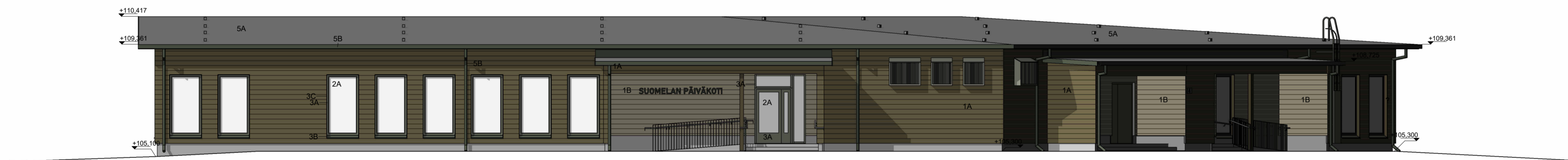
Julkisivu pohjoiseen 1 : 100