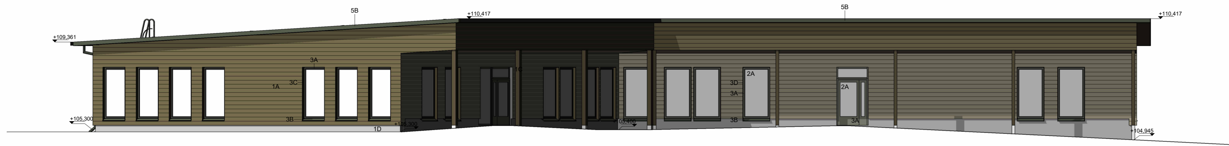
Julkisivu etelään 1 : 100